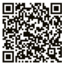
Esta caja de herramientas

Una caja de herramientas para la elaboración de leyes y políticas públicas tiene tres partes.